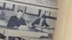
НА СНИМКАХ: занятия на военной кафедре.

ОПА — на фронте. ОПА — на фронте. ОПА — на фронте. ОПА — на фронте.